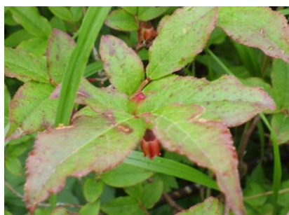
(オオバスノキ・鬼ヶ城)