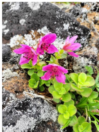
(エゾツツジ・鬼ヶ城)