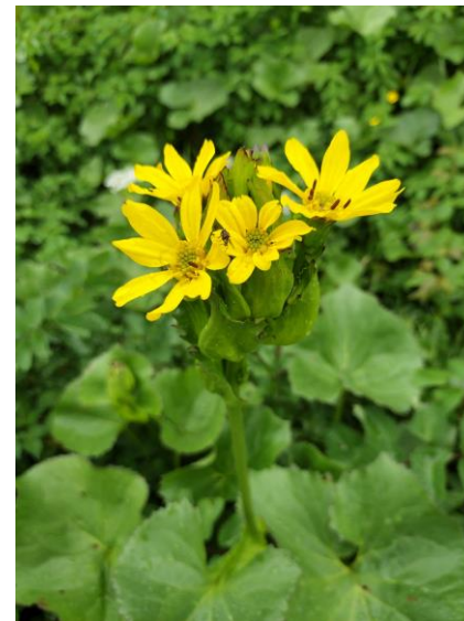
(トウゲブキ・お花畑)